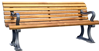
PARKBÄNKE Modell Berlin L+AL