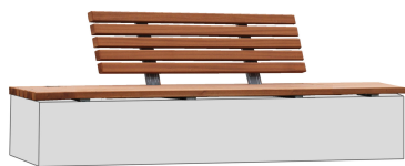
BANKAUFLAGEN Modell Hameln