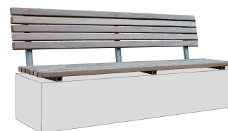
BANKAUFLAGEN Modell Minden L