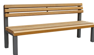
PARKBÄNKE Modell Rostock L