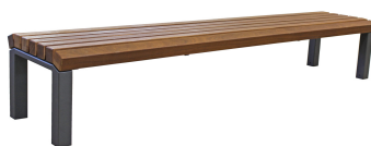
PARKBÄNKE Modell Rostock H Lang