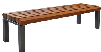
PARKBÄNKE Modell Rostock H