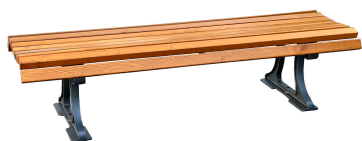
PARKBÄNKE Modell Berlin H