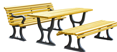
SITZGRUPPEN Modell Berlin