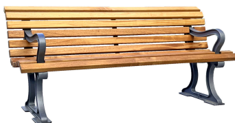
PARKBÄNKE Modell Berlin L+AL