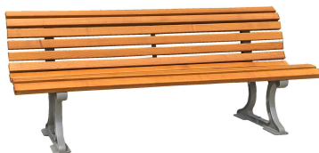
PARKBÄNKE Modell Berlin L