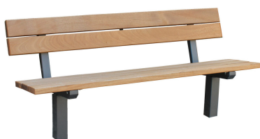
PARKBÄNKE Modell Göttingen L