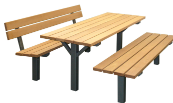
SITZGRUPPEN Modell Göttingen