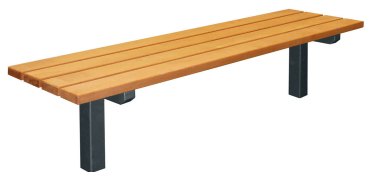
PARKBÄNKE Modell Göttingen H