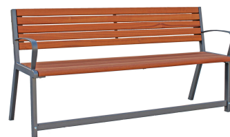
PARKBÄNKE Modell Kiel L SEN – "die Seniorenbank"