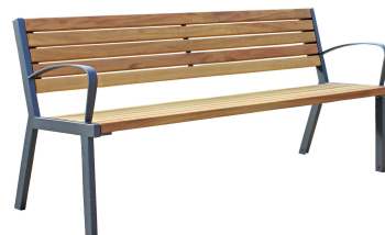
PARKBÄNKE Modell Kiel L+AL