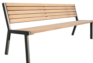
PARKBÄNKE Modell Kiel L