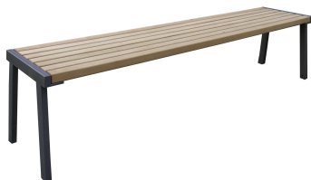
PARKBÄNKE Modell Kiel H