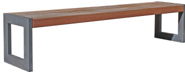
PARKBÄNKE Modell Koblenz H