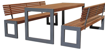
SITZGRUPPEN Modell Koblenz