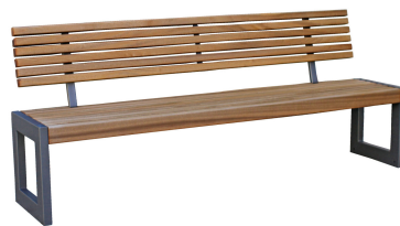
PARKBÄNKE Modell Koblenz L