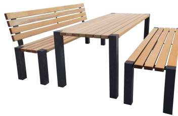
SITZGRUPPEN Modell Konstanz