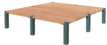
PODESTE Modell Konstanz P