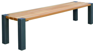
PARKBÄNKE Modell Konstanz H