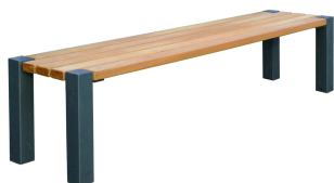
PARKBÄNKE Parkbank Modell Konstanz H