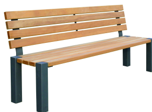
PARKBÄNKE Parkbank Modell Konstanz L