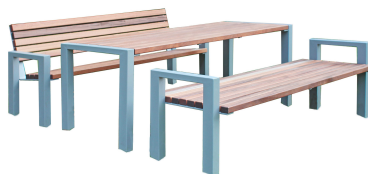
SITZGRUPPEN Modell Ludwigshafen