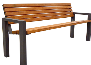
PARKBÄNKE Modell Ludwigshafen L