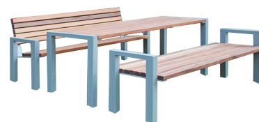
SITZGRUPPEN Modell Ludwigshafen