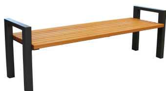
PARKBÄNKE Modell Ludwigshafen H