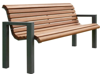
PARKBÄNKE Modell Mannheim L