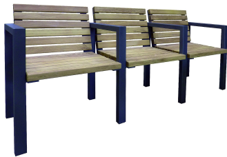
PARKBÄNKE Modell Oberhausen L Sitzreihe