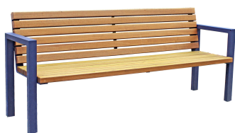
PARKBÄNKE Modell Oberhausen L