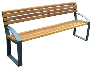
PARKBÄNKE Modell Oranienburg L