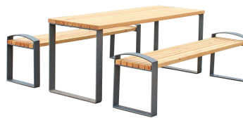
SITZGRUPPEN Modell Oranienburg