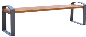
PARKBÄNKE Modell Oranienburg H