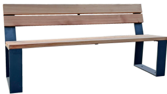
PARKBÄNKE Modell Prenzlau L