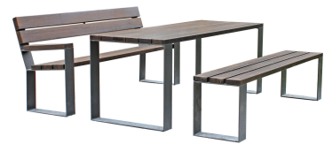
SITZGRUPPEN Modell Prenzlau