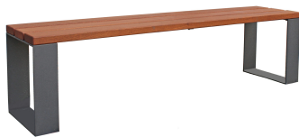
PARKBÄNKE Modell Prenzlau H