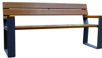
PARKBÄNKE Modell Prenzlau L+AL