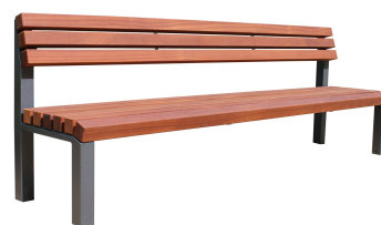
PARKBÄNKE Modell Rostock L Lang