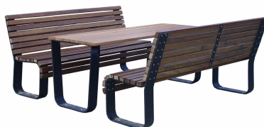
SITZGRUPPEN Modell Saalfeld