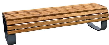
PARKBÄNKE Modell Saalfeld H