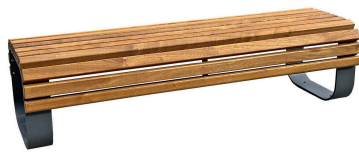
PARKBÄNKE Modell Saalfeld H