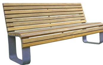
PARKBÄNKE Modell Saalfeld L