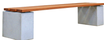
PARKBÄNKE Modell Würzburg H